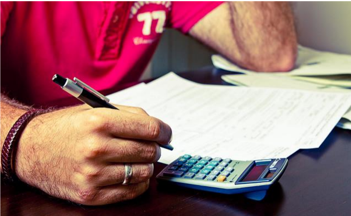
Foto: una persona hace cuentas.

Una vez al año, todo el mundo hace cuentas con su dinero.